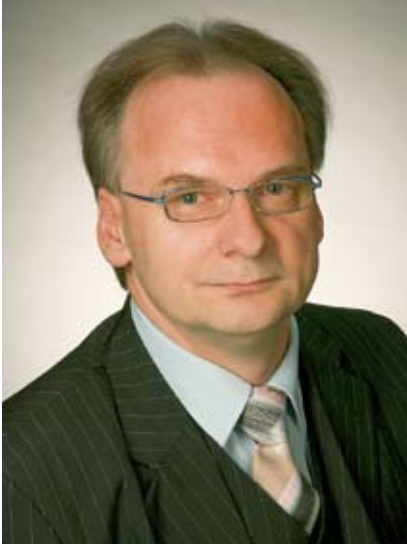
DR. REINER HASELOFF Minister für Wirtschaft und Arbeit Sachsen-Anhalts DR. REINER HASELOFF Minister for Economics and Labour in Saxony-Anhalt